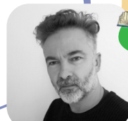
BARROUX Samedi & Dimanche