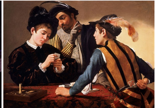
Les tricheurs par Caravage vers 1595