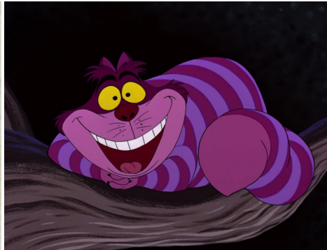
Le chat du Cheshire dans Alice a pays des merveilles de Lewis Carroll (ici la version de Disney)