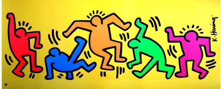
Untitled ou la danse multicolore de Keith Haring