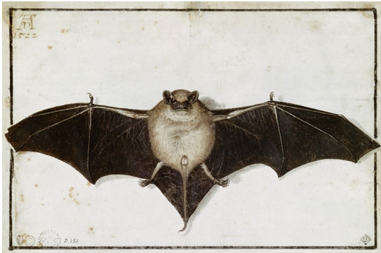
Chauve-souris d'Albrecht Durer, 1522