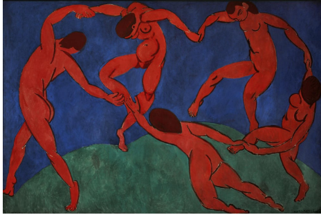
La danse de Henri Matisse, 1910.