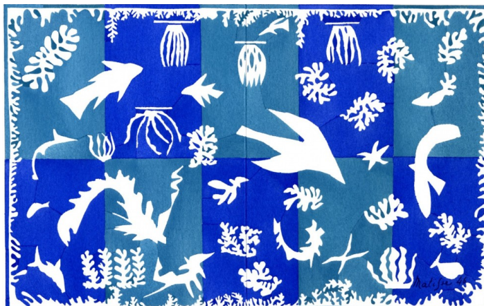
Henri Matisse, « Polynésie », 1946.