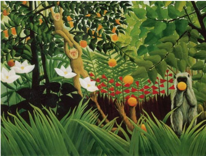
Paysage exotique avec des singes jouant, H. Rousseau, 1910