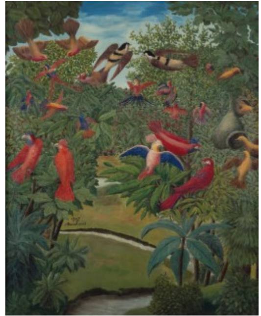
André Bauchant oiseaux exotiques 1936