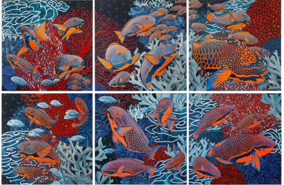
La danse, acrylique sur toile , 6 tableaux de 100x100cm