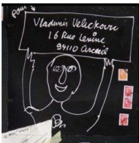
BEN à Véllickovic

Une des conditions essentielles de l'art postal c'est qu'il doit passer par les services postaux. L'expéditeur n'exerce plus aucun contrôle sur son envoi, ne sachant ni s'il parviendra à bon port, ni dans quel état il y parviendra. Les traces de l'acheminement font partie de l'« œuvre ». L'oblitération est essentielle.