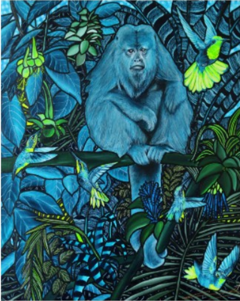
Cacophonie , acrylique sur toile, 40x50cm