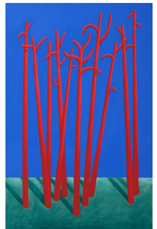
Nicolas Party, landscape, 2014 Nicolas Party, trees, 2014