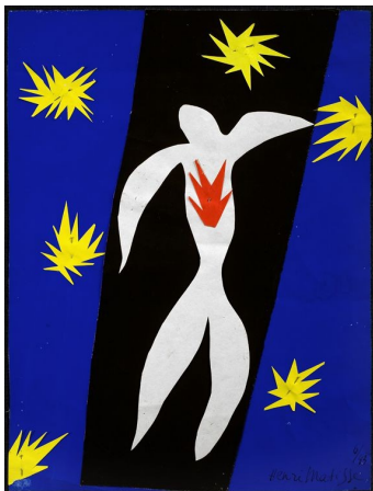
Henri Matisse, "Icare", 1947.